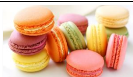
Macarons aux deux parfums (Matin et Après-midi)