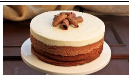
Entremets aux trois chocolats (Matin et Après-midi)