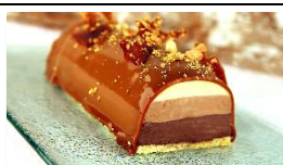
Bûche de Noël – Chocolat/Caramel