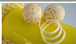
Bûche de Noël aux fruits