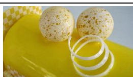
Bûche de Noël aux fruits