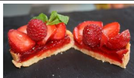
Tarte Fraises et Framboises