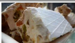
Nougats et Guimauve