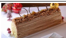
Bûche de Noël