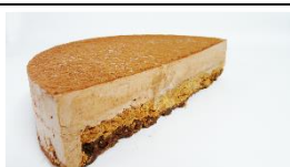
Royal au chocolat