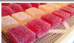
Pâte de fruits et caramel